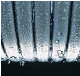
Schimbătorul de căldură Inox-Radial – durabil și eficient

Vitodens 100-W Vitodens 111-W 4,7 până la 35,0 kW