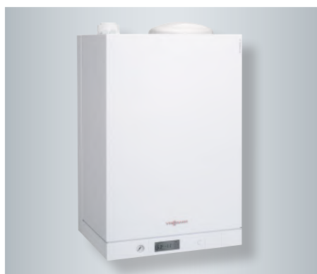
Vitodens 111-W cu acumulator a.c.m. de 46 litri