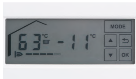
Ecran LCD touchscreen

Cazanele murale în condensatie Vitodens 100-W și Vitodens 111-W se reglează prin display-ul LCD Touchscreen. Ecranul iluminat poate fi vizualizat și utilizat cu ușurință, chiar și în împrejurimi mai întunecate.